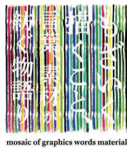
mosaic of graphics words material

幼児教育と芸術教育で世界的に注目を集めている、イタリアのレジオ・エミリア市の子どもたちの作品と、その作品が生み出されるまでのドローイングプロセスを集めた展覧会です。2015年にイタリアで開催後、世界6か国(8都市)に巡回。日本初公開となる今回、国内で巡回展を行います。